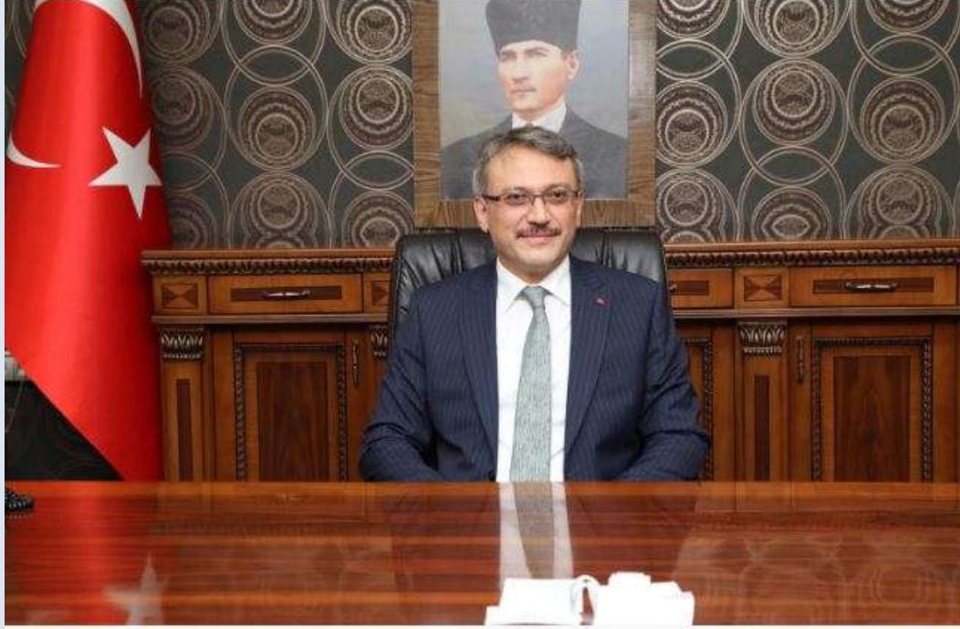
Kadir EKİNCİ Bingöl Valisi